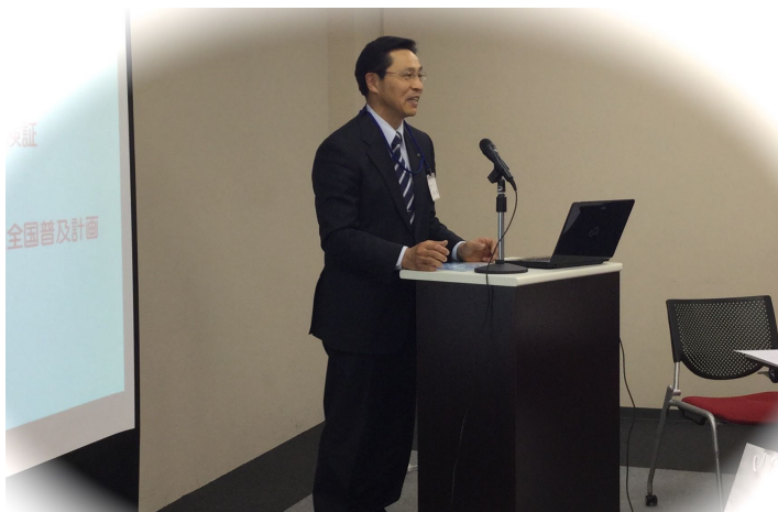
会長挨拶：三重県いなべ市 日沖 靖市長

内容：第 1 部では、「元気づくりシステム」を活用した地域包括ケアシステムの構築にむけて、その政策モデルである「地域 PU システム」を研究するため、元気づくりシステム先行導入自治体の首長及び担当者による検証と報告が行われた。第 2 部では、元気づくりシステム全国普及計画（長・中・短期）が協議され、研究会で検討すべき同システムの可能性や新しい課題等を含めて、普及計画の方向性が確認された。