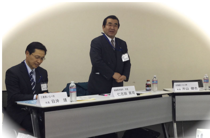
挨拶：福島県伊達市 仁志田昇司市長